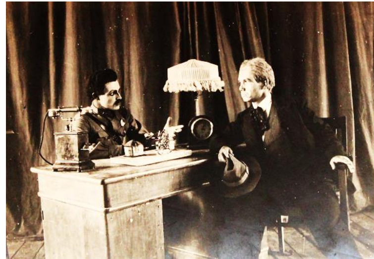
«Слава» В. Гусева, 4-е действие, ДВК Сысоевка, 25 апреля 1939 г.

В 1938 году в театр пришел актёр и режиссёр А.А. Присяжнюк, впоследствии один из наиболее выдающихся режиссёров театров Приморья, педагог, народный артист СССР. Им были поставлены спектакли: «Простая девушка» В. Шкваркина, «Не всё коту масленица» А. Островского, «Любовь Яровая» К. Тренёва, которые прочно вошли в репертуар театра и принесли ему широкую известность.