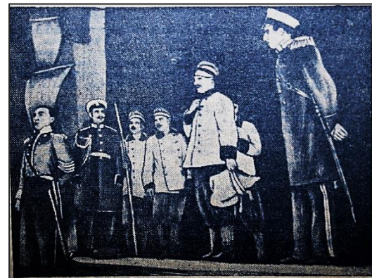
«Адмирал Нахимов» в постановке ТОФ

Коллектив взял в работу «Разлом» Б. Лавренева. Премьера спектакля состоялась 8 января 1933 года. Это была первая серьёзная заявка театра, в которой была выражена его творческая программа.